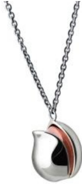
開心果 925 純銀晶石頸鏈

開心果是常見的乾果零食; 而在本土文化中, 「開心果」也被用來借喻 風趣幽默、為別人帶給歡樂 的人。同系列的開心果吊墜, 以 925 純銀的果殼, 包裹著人手雕成的不同類型晶石當成開心果的果子; 可用來送給我們身邊的「開心果」。