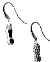
長生果 925 純銀耳環