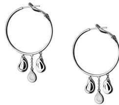
瓜子 925 純銀圈耳環