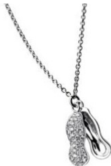
長生果 18k 白金 鑽石吊墜

花生的「生」字寓意生育或 連生貴子 ；所以花生在中國人的婚宴上也是常見的款客小吃，古人有云「花著生」，意即既生男，又生女。在內地，花生則被稱為「長生果」，是象徵 長生不老 的吉祥果。「花生瓜子」系列有 925 純銀或 18K 黃金鑄造的花生耳環，吊墜和手鍊；而造型分別有寫實的完整花生，花生殼半開展露以珍珠演繹的花生，或抽象形態的扭紋花生殼；各配以光身打磨或鑲鑽來點綴。